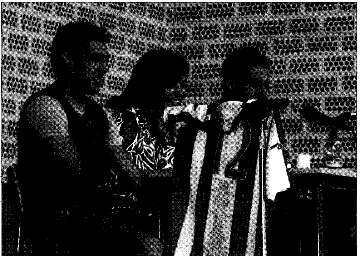
El delantero madrileño dijo que "esperaré hasta final de temporada para aclarar mi situación". / JAVIER GUTIÉRREZ

BERJA → Los jugadores rojiblancos visitaron el IES Villavieja