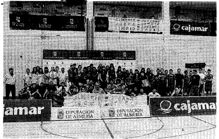
PREMIADOS. Galardonados en categorías juvenil y femenina.